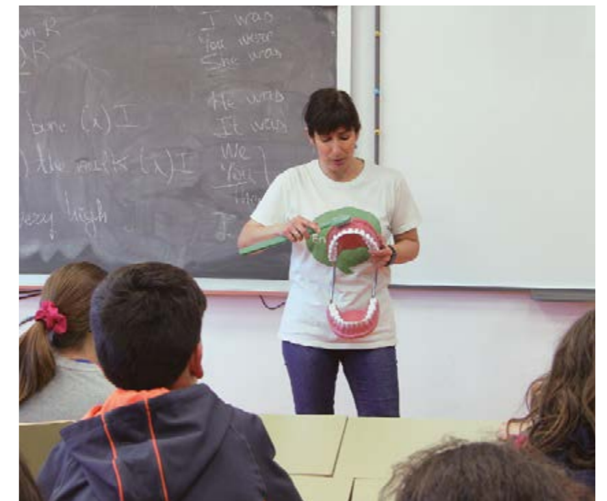
Una enfermera durante una charla a alumnos de un colegio de Castilla y León

El Sindicato recordó también que la enfermera escolar "desarrolla un importante trabajo asistencial y de cuidados al alumnado siempre que lo requiera y más en casos de alumnos con necesidades especiales". Pero, además, las enfermeras y enfermeros pueden desarrollar "una importante labor informativa y de educación sanitaria de cara a lograr que los niños, niñas y jóvenes adquieran hábitos de vida saludables que les alejen del tabaco, alcohol o las drogas, por ejemplo, o que eviten problemas de salud, como la obesidad". ■