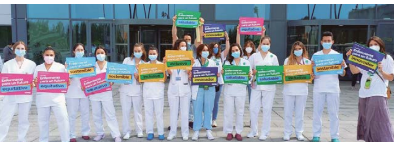
Enfermeras de Salamanca en una reciente concentración celebrada en esta ciudad

REIVINDICACIONES UNA MEJORA PARA LAS ENFERMERAS DE CASTILLA Y LEÓN