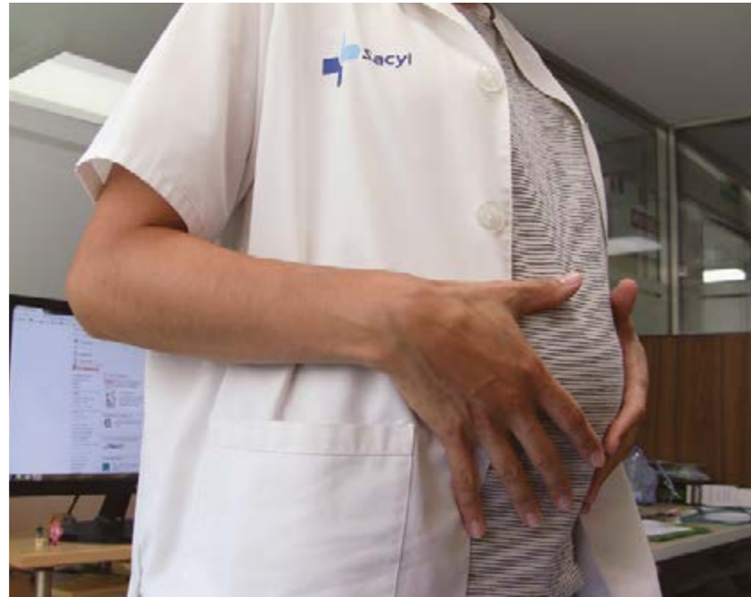
Los tribunales reconocen el interés superior del menor

En este sentido, los juzgados señalan, como en la citada Convención, que se deben "adoptar todas las medidas para que el niño se vea protegido contra toda forma de dis-