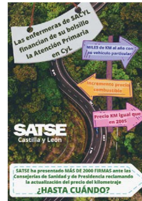
Cartel de SATSE alusivo a la campaña

Los sanitarios son los empleados de la Junta de Castilla y León más afectados por el incremento del precio de los carburantes, ya que