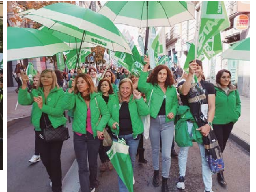
A la izquierda, manifestación de SATSE en Madrid el pasado 22 de octubre, junto a otras organizaciones. Arriba, enfermeras y delegadas de SATSE Castilla y León ese mismo día, y abajo, protesta ante la Subdelegación del Gobierno en León

No hay que olvidar que estas movilizaciones se suman a las convocadas por SATSE en todas las provincias de Castilla y León a lo largo del año exigiendo mejoras en Atención Primaria y Atención Especializada que palien la crónica escasez de medios y recursos que padecen, mientras la sobrecarga y la tensión asistencial aumenta. ▣