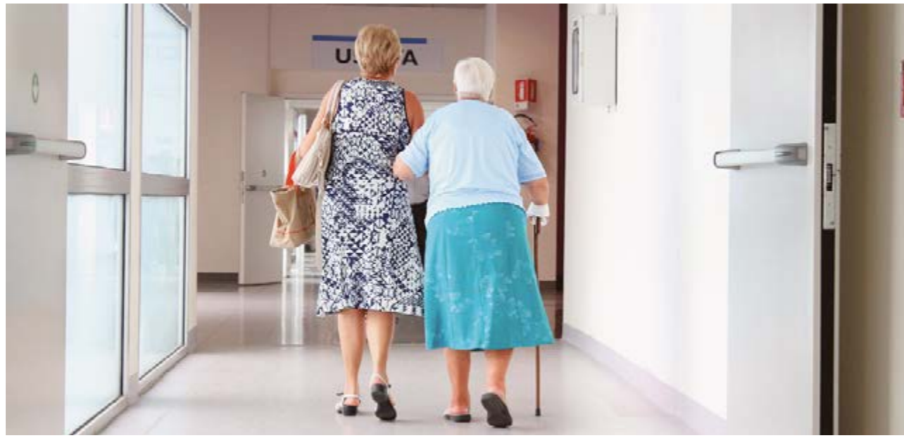
El alto índice de envejecimiento en la Comunidad hace imprescindibles a las enfermeras