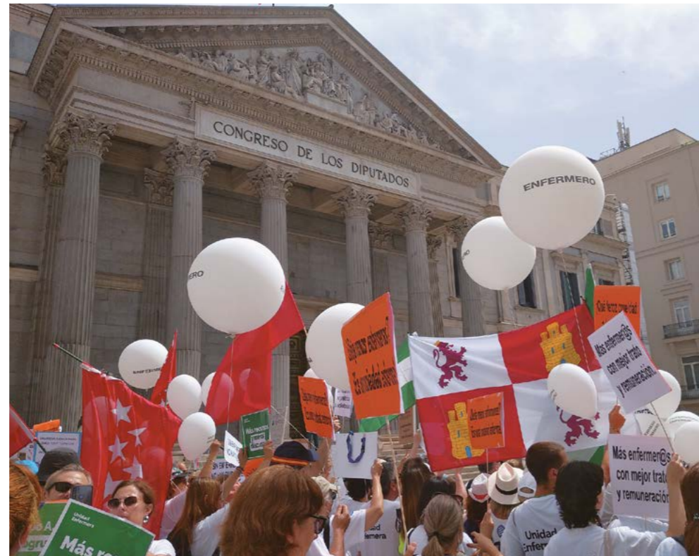
Manifestación en Madrid y, en la página siguiente, protesta de SATSE Castilla y León el 12 de mayo

También el 22 de febrero, SATSE convocó una concentración a la entrada de los hospitales para exigir medidas que paliaran esa sobrecarga asistencial que viven las enfermeras y recordar que es ne-