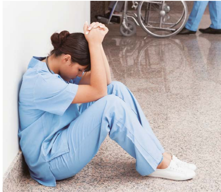
Imagen de archivo

SATSE ha insistido en que el de Enfermería es un colectivo mayoritariamente femenino y en las agresiones "puede haber un sesgo de género que esté incidiendo en que se produzcan más ataques con-