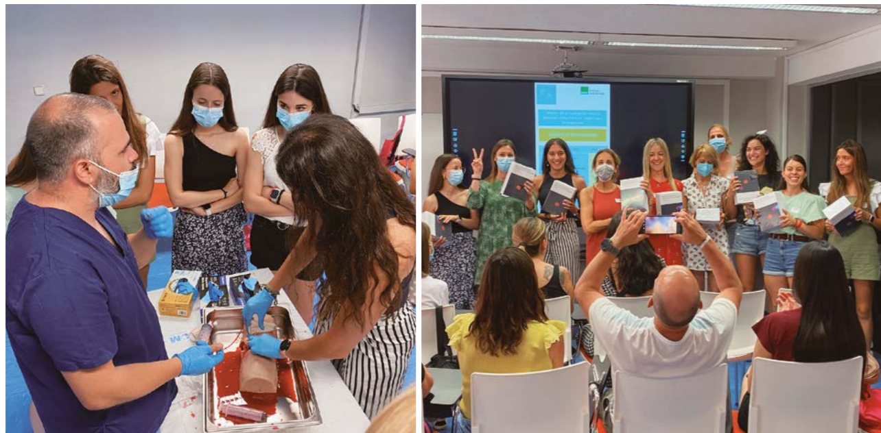
Imágenes de los talleres que se han celebrado en los másteres de SATSE Castilla y León

Dedicados a "Fisioterapia respiratoria" y a "Procesos e intervenciones enfermeras al paciente adulto en situaciones de urgencia y riesgo vital"