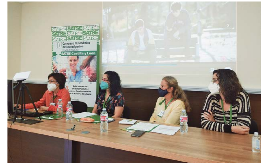
Una de las mesas de ponencias del Congreso de Investigación

Desde SATSE se afirmó que “cada vez más, la profesión está más implicada en la investigación