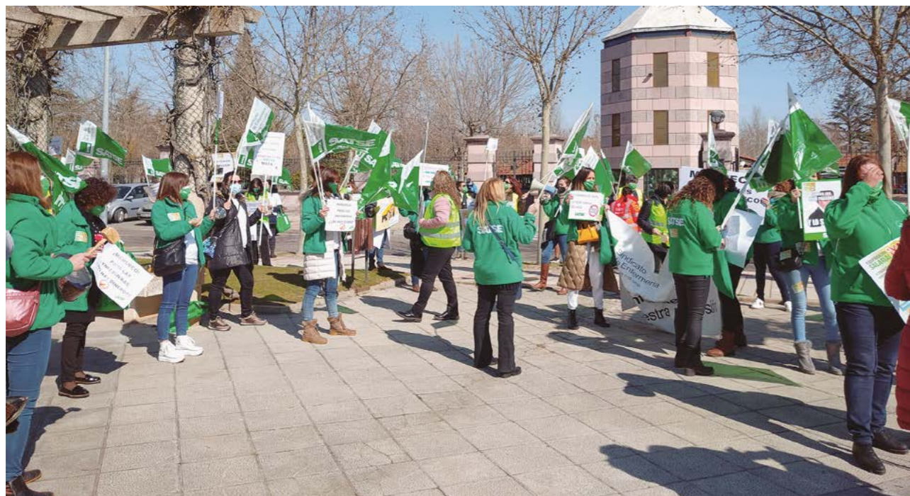
Una protesta de SATSE ante la Consejería de Presidencia de la Junta de Castilla y León

El Sindicato de Enfermería considera que no es el momento de avanzar en esta ley porque se va a llevar a cabo una modificación del EBEP a nivel estatal