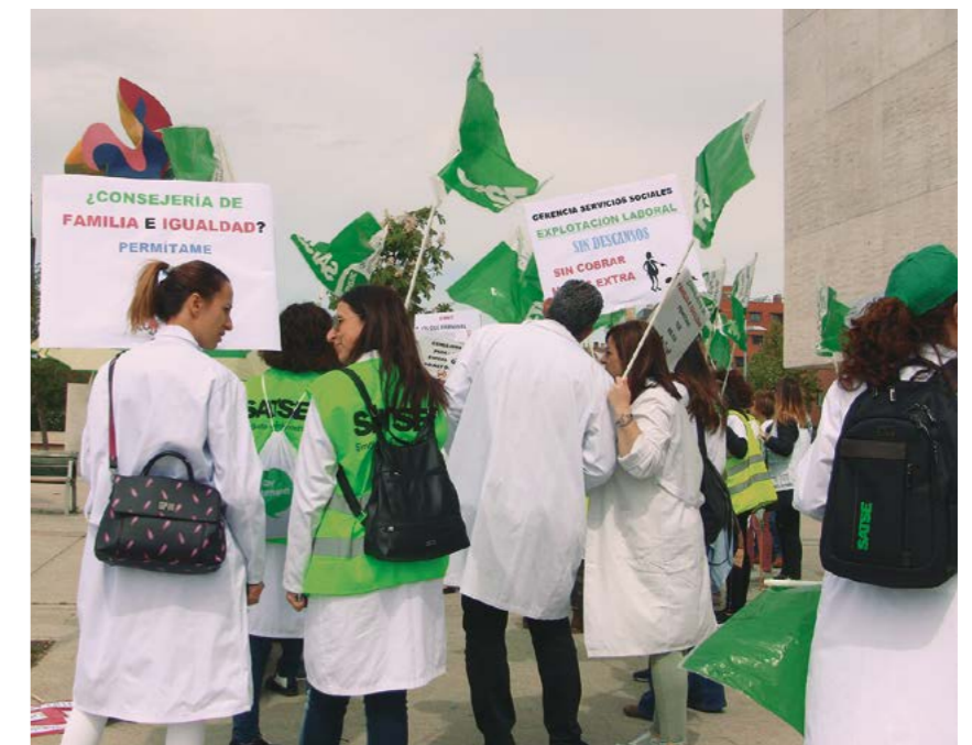
Una concentración de SATSE ante las Cortes regionales para exigir mejoras para estas enfermeras

Tras un año y medio en que estas profesionales han vivido la dura situación de las residencias en la pandemia, están “agotadas”, según SATSE, porque no hay una plantilla suficiente que garantice que se puede cubrir la asistencia con la calidad que debe darse en estos centros. A estas condiciones de sobrecarga de trabajo por la falta de suficientes enfermeras se ha unido ahora la vacunación de los residentes con la tercera dosis frente al Covid, lo que está sobrecargando y agotando aún más a las enfermeras. “Se garantiza la asistencia solo gracias al tremendo