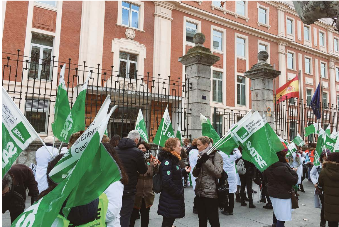
El Sindicato de Enfermería ha estado defendiendo y apoyando a los profesionales durante estos cuatro años

SATSE también ha logrado que las enfermeras y enfermeros de Atención Primaria de Castilla y León y Emergencias cobren la manutención, a la vez que varias sentencias ganadas recientemente por el Sindicato de Enfer-