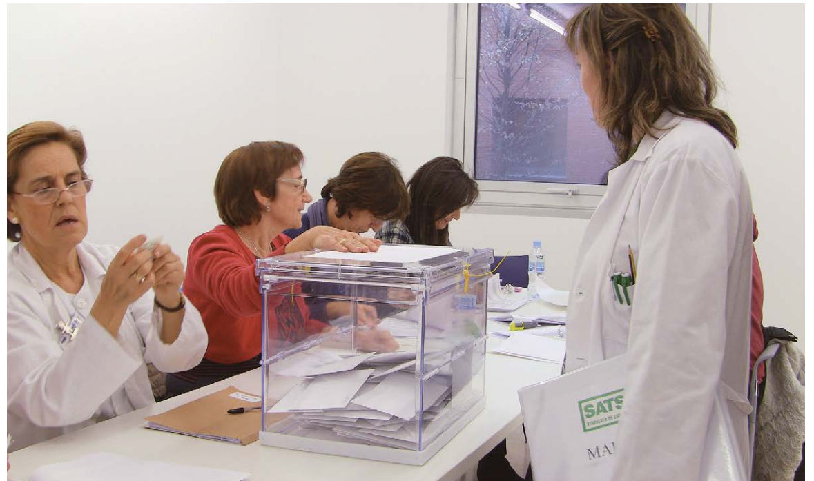
Una enfermera ejerciendo su derecho al voto