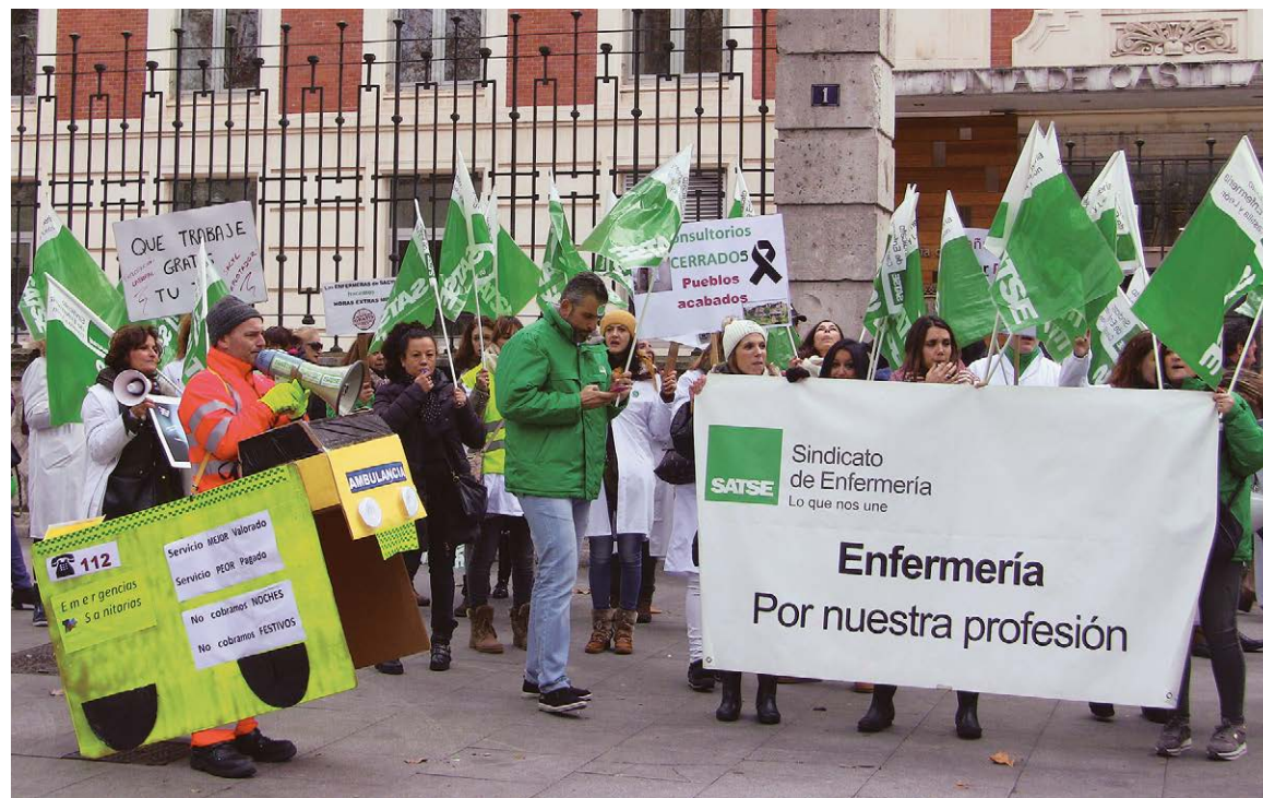
Las delegadas y delegados de SATSE han liderado la defensa de la Enfermería y Fisioterapia en todos los ámbitos de negociación, en los tribunales, en los centros sanitarios y en las calles

El voto de los profesionales permitirá a SATSE contar con representantes que puedan estar presentes en los centros a través de las secciones sindicales y sus de-