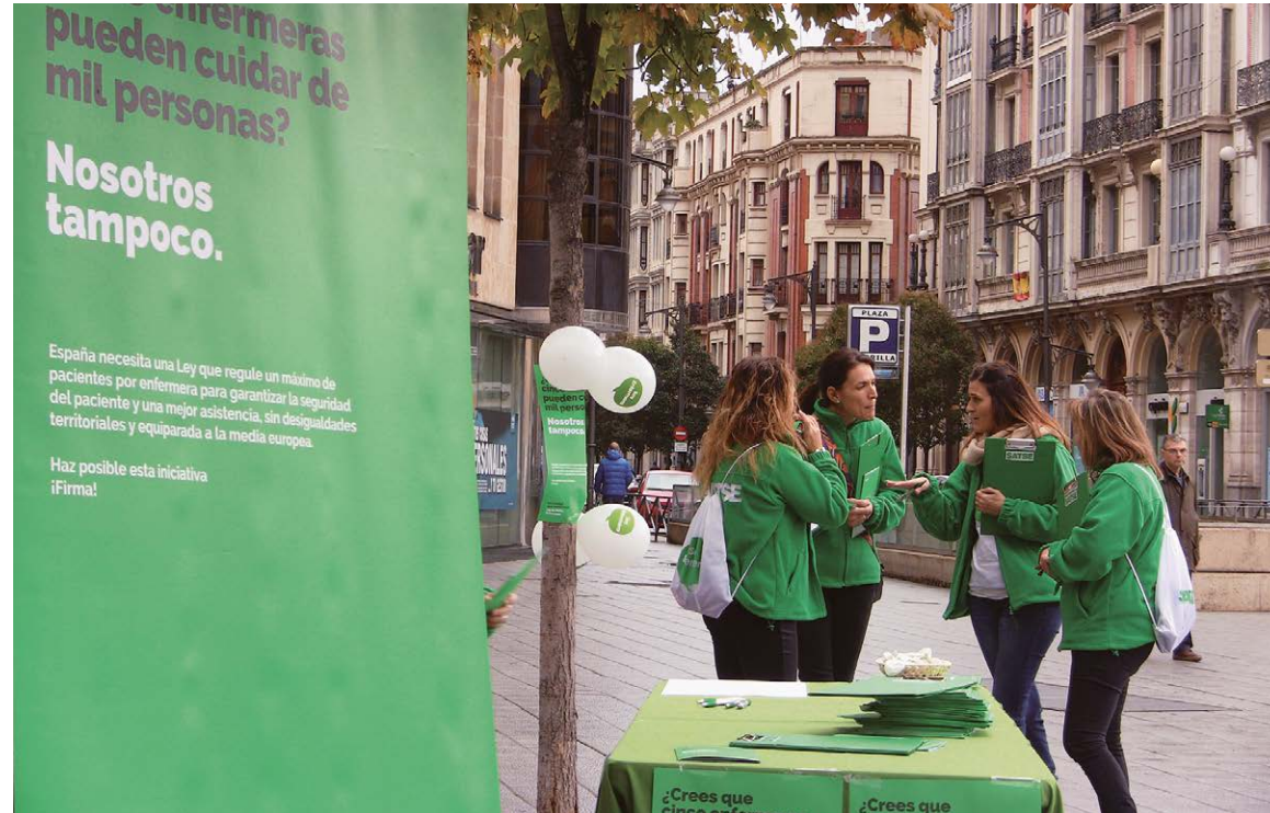
Recogida de firmas para lograr la Ley de Seguridad del Paciente

En cuanto a los fisioterapeutas, en Castilla y León en concreto hay uno solo para atender a 6.102 personas en la sanidad pú-