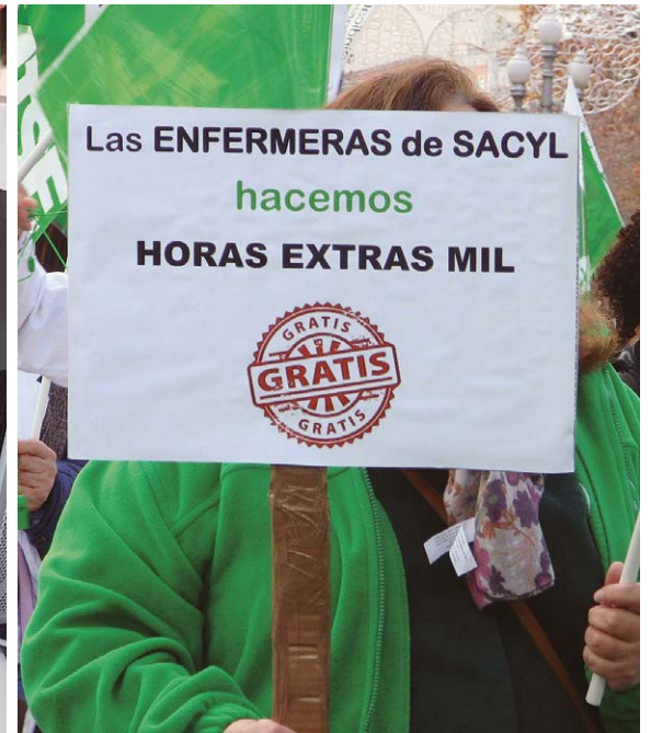
El avance en las competencias de enfermeras y fisioterapeutas y sus retribuciones son asuntos por los que SATSE mantiene una lucha constante